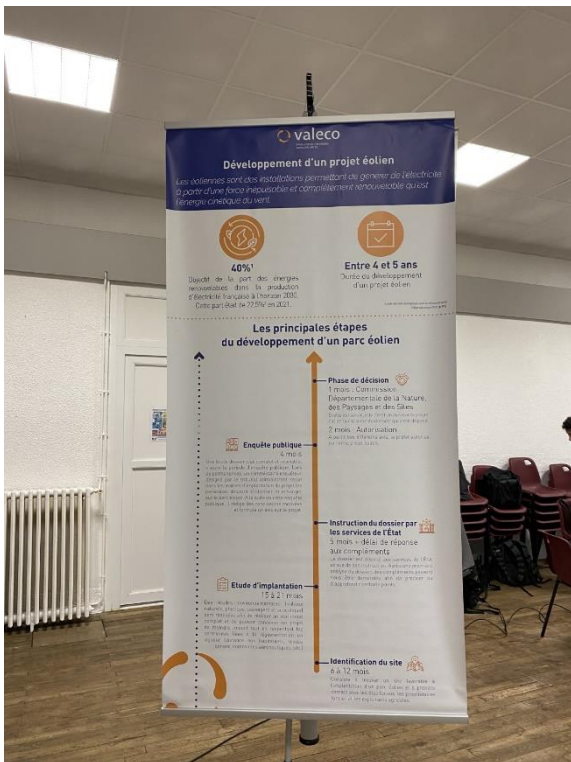
Figure 1 : Support décrivant le déroulement d'un projet éolien