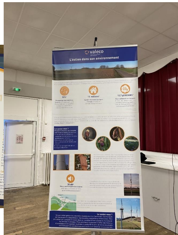
Figure 2 : Support décrivant l'intégration de l'éolien dans son environnement