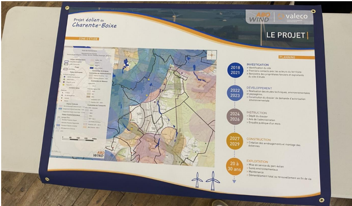
Figure 4 : Support montrant les avancées du projet éolien de Charente-Boixe