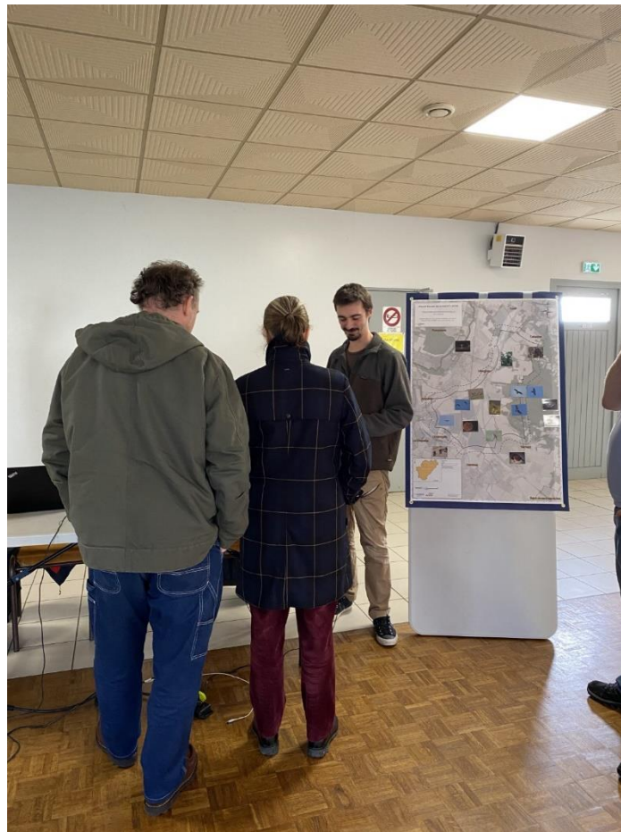
Figure 5 : Photographie prise lors d'une explication des experts naturalistes

Le bureau d'études ENCIS Environnement était également présent pour exposer le déroulement de l'étude naturaliste ainsi que les principaux résultats connus à ce jour.