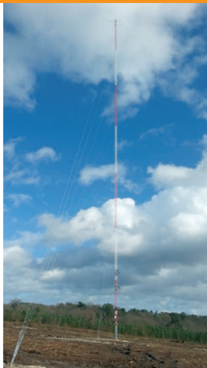
Mât de mesure de 100 m sur une zone d'étude

La connaissance des caractéristiques du vent sur le site étudié permettra de définir le ou les types d'éoliennes les plus adaptés au site , d'évaluer la distance à prévoir entre les éoliennes et enfin d' estimer précisément la production électrique du futur parc éolien.