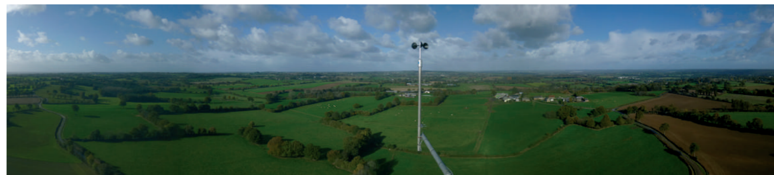
Vue depuis le mât de mesure de Saint-Hilaire-du-Maine (53).