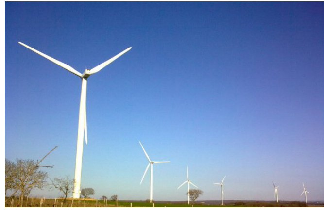
Parc de Salles-de-Villefagnan (16)

Mis en service en 2008 9 Nordex Ngo 20.7 MW installés