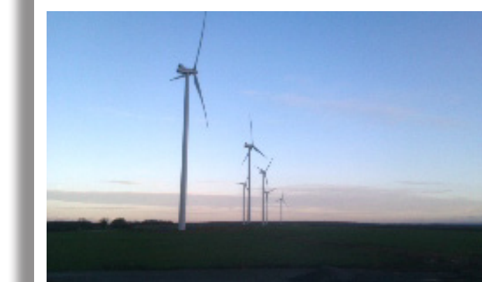
Parc de Moquepanier (16)

Mis en service en 2014 8 Vestas V90 16 MW installés