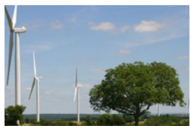
Parc de Xambes (16)

Mis en service en 2008 6 Nordex Ngo 13.8 MW installés