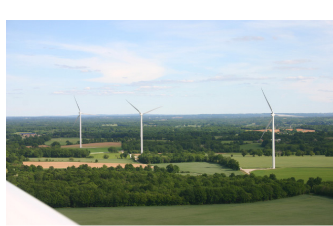
Parc du Confolentais (16)

Mis en service en 2015 6 Vestas V110 12 MW installés