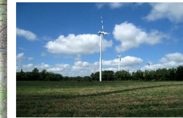
Parc de Saulgond Lesterps (16)

Mis en service en 2010 7 Vestas V90 14 MW installés