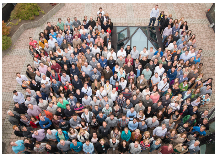
Groupe ABO Wind

Parce que l'éolien est une énergie de territoire, ABO Wind développe main dans la main ses projets éoliens avec les acteurs locaux. Cela se traduit par une communication et une concertation tout au long du développement de ses projets. De plus, ABO Wind met tout en œuvre pour, qu'une fois en fonctionnement, les retombées économiques des parcs éoliens restent au niveau local, gage d'un réel développement durable . Début 2017, ABO Wind a, en ce sens, mis en service en Loire-Atlantique son septième parc éolien financé en partie par des particuliers.