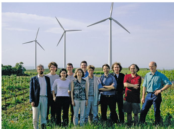
Création d'ABO Wind, en 1996