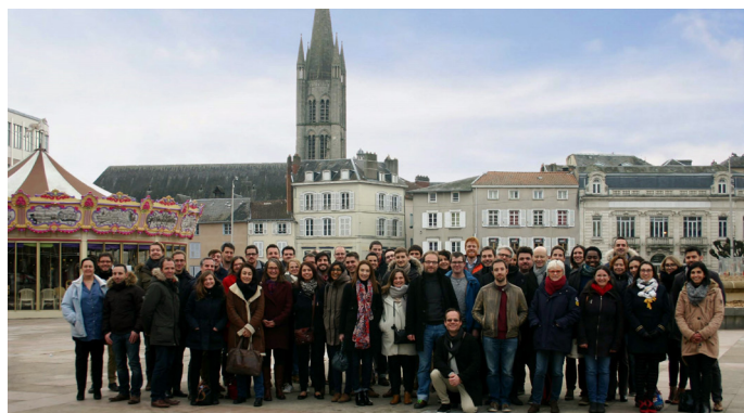
ABO Wind France

Avec quatre agences à Nantes, Orléans, Lyon et Toulouse (siège social), ABO Wind a contribué au développement de l'énergie éolienne en France en mettant en service 22 parcs éoliens , ce qui représente 144 éoliennes et une puissance globale de 278 MW . La production issue de ces éoliennes représente la consommation d'électricité domestique d'environ 300 000 personnes, soit l'équivalent de la ville de Nantes ou de la moitié du département des Côtes d'Armor.