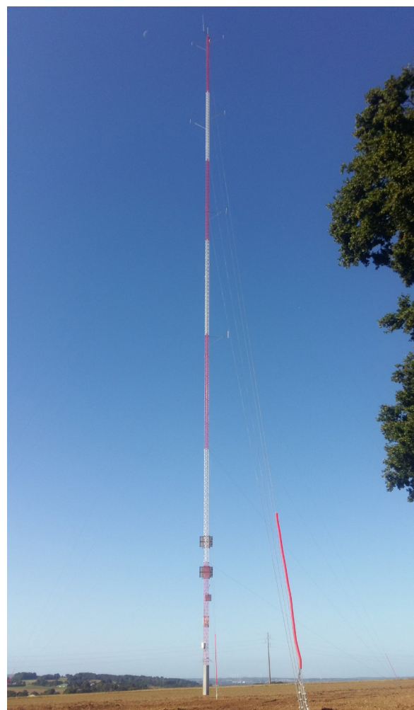
Mât de mesure entre Botconnaire et Coët Drien

L'analyse des données collectées et leur corrélation avec celles des stations Météo-France régionales et des modélisations numériques spécialisées, permettront de caractériser le site quant aux directions et aux vitesses des vents dominants. Ces analyses contribueront à choisir le modèle d'éolienne le plus adapté au site et à évaluer précisément la production électrique du futur parc éolien.