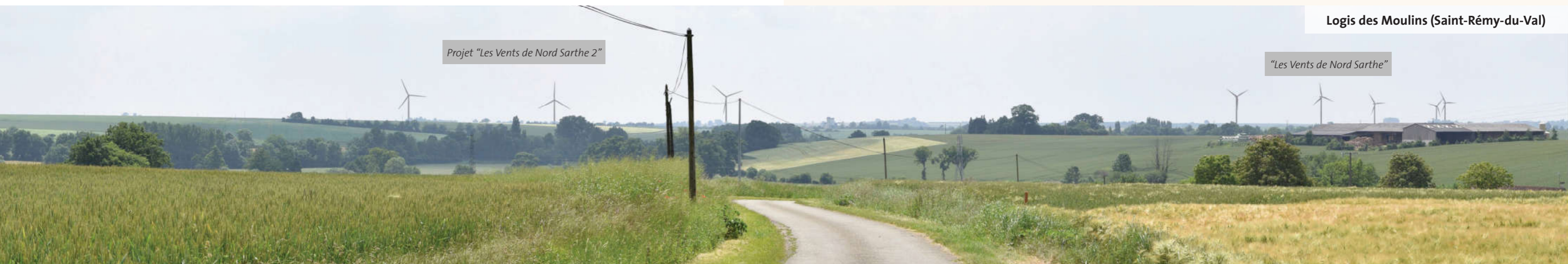
Projet "Les Vents de Nord Sarthe 2"