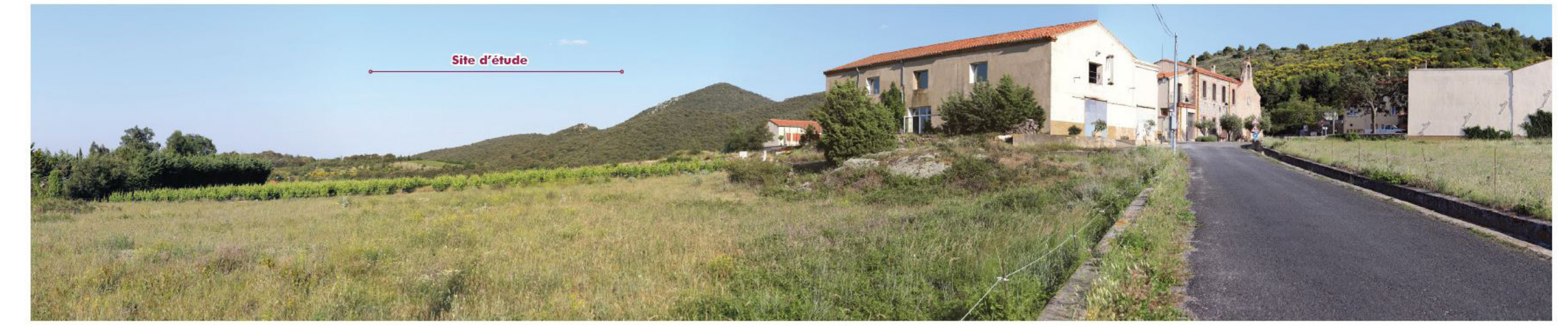
23 Trilla - Entrée village Nord 6,57 km Sud-Ouest