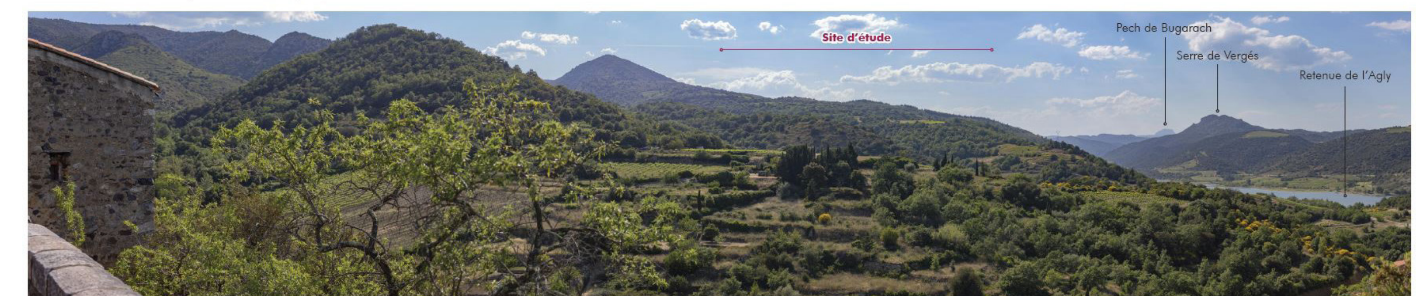
17 Caramany - Centre bourg 2,14 km Est