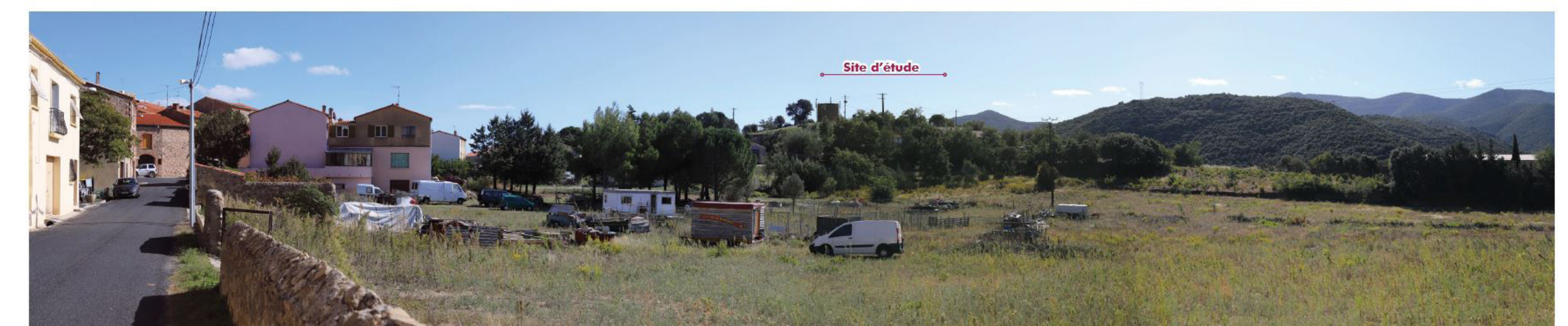
47 Ansignan - Bourg, D 619 2,60 km Nord-Ouest