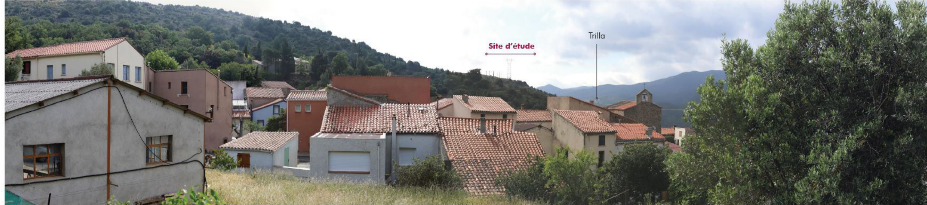
29 Felluns - Bourg 5,05 km Nord-Ouest