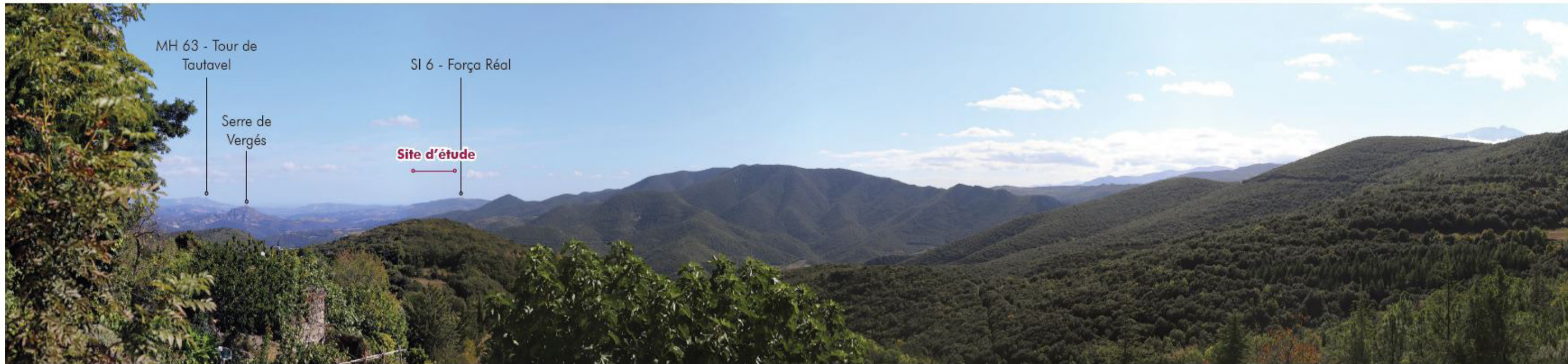
48 Prats-de-Sournia - Centre bourg 6,37 km Ouest