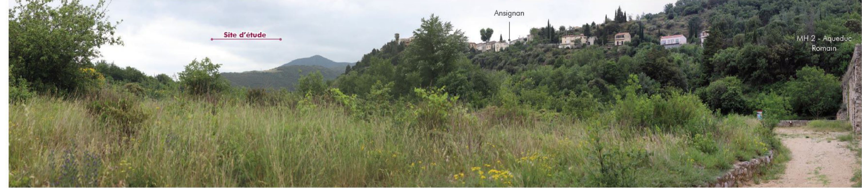
39 Ansignan - Aqueduc Romain, MH 2 3,03 km Nord-Ouest