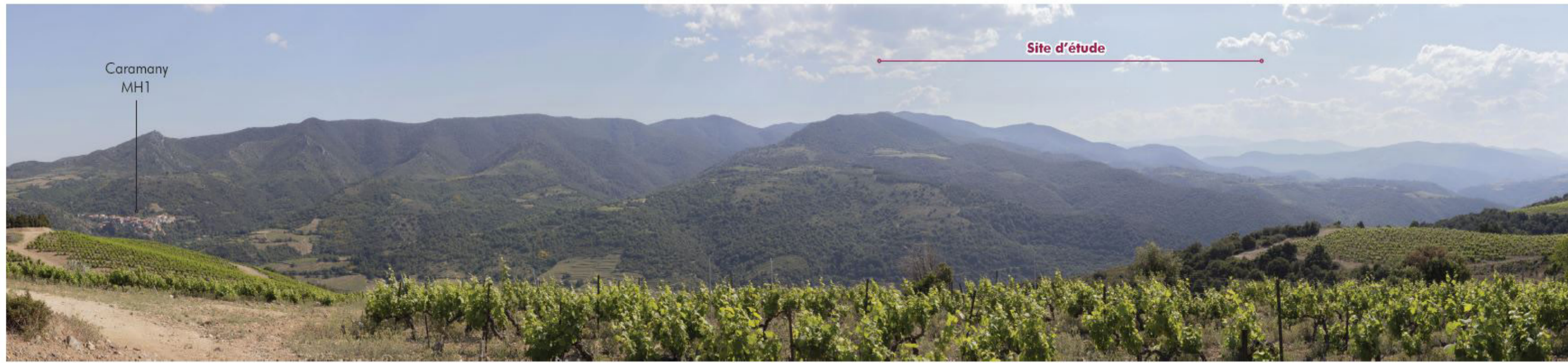
13 Caramany - Relief des Fenouillèdes, sentier de randonnée 2,03 km Nord-Est