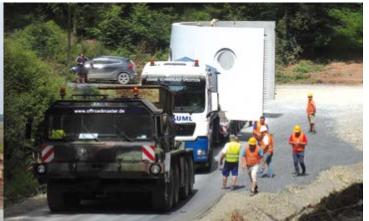
Um die bis zu 18-prozentige Steigung zu bewältigen und die Betonturmteile zum Ziel zu bringen, kommen außergewöhnliche Transportmittel zum Einsatz.