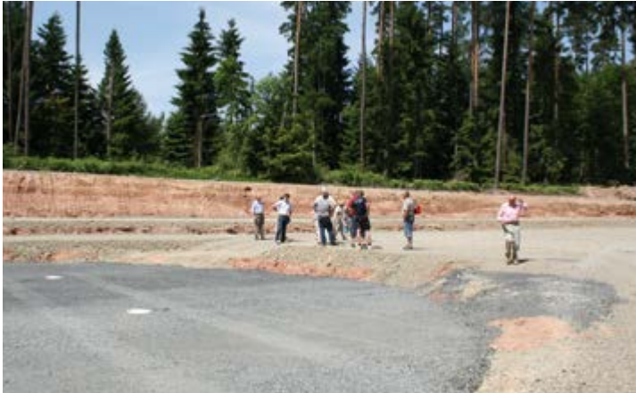
Bei Führungen über die Baustelle informieren sich interessierte Bürger darüber, wie der Windpark Schlitz-Berngerode entsteht.