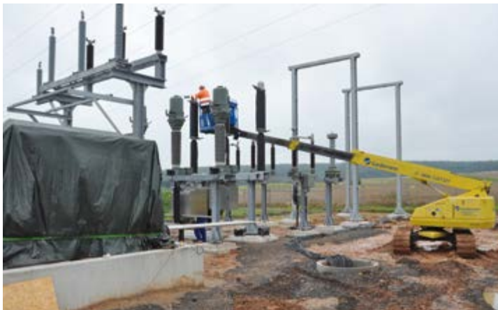
Für den Windpark wird ein eigenes Umspannwerk gebaut. Hier wird die im Windpark erzeugte elektrische Energie von 30 Kilovolt Mittelspannung auf Hochspannung transformiert und ins 110 Kilovolt-Netz eingespeist.