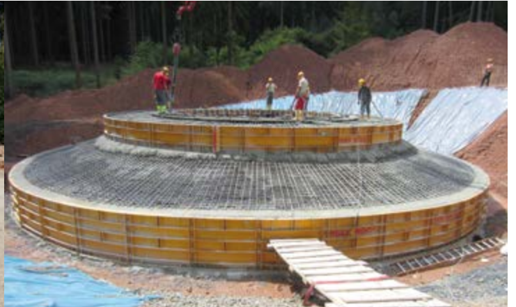
Das rund drei Meter tiefe Fundament einer Anlage wird vorbereitet. Darauf wird der knapp 90 Meter hohe Betonturm errichtet.